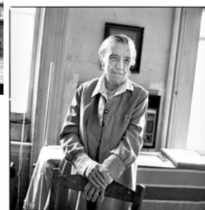
LOUISE BOURGEOIS dans sa chambre, en 1996.

Figure majeure de l'art du XX e siècle, Louise Bourgeois a laissé une œuvre considérable qui comprend aussi bien des sculptures que des installations, des dessins et des peintures. Née en France en 1911, installée à partir de 1938 à New York après avoir épousé l'historien d'art américain Robert Goldwater, elle y passera toute sa vie.