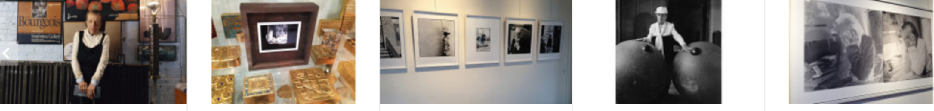
Une incroyable rencontre