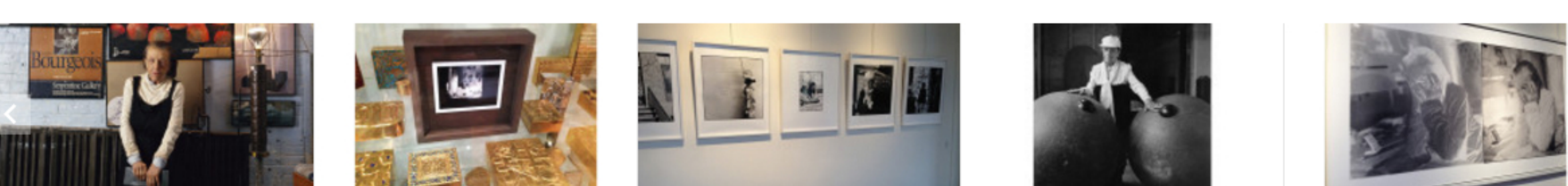
Une incroyable rencontre