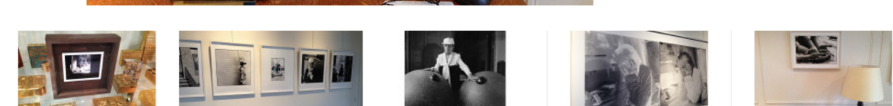
Avec vue sur le Palais Bourbon