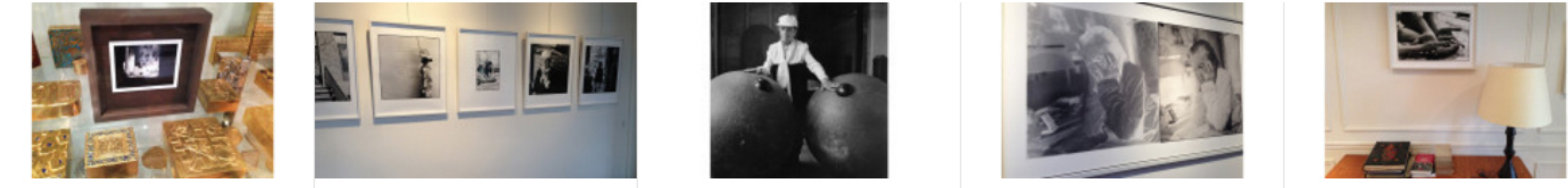
Avec vue sur le Palais Bourbon