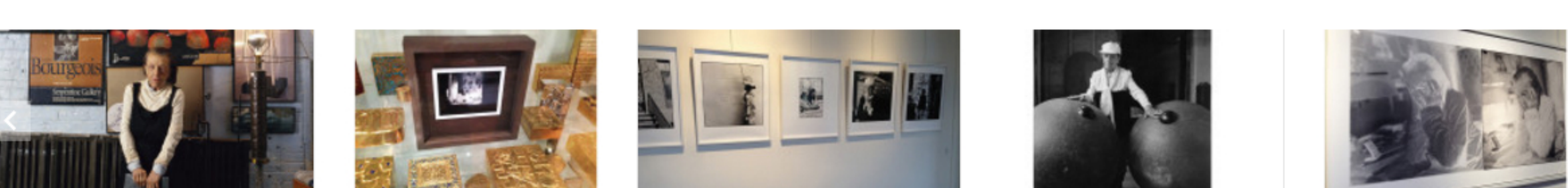
Une incroyable rencontre