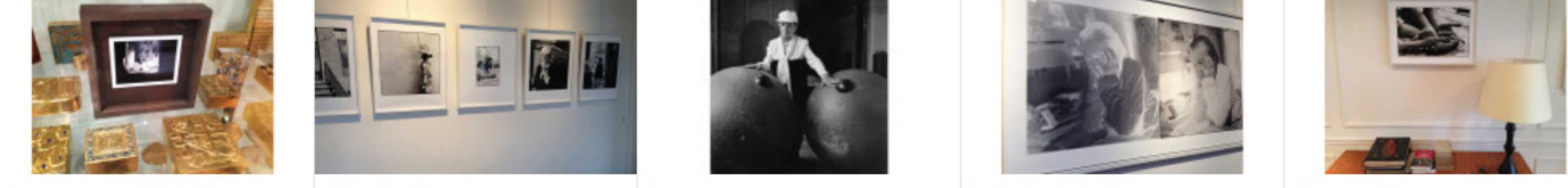
Avec vue sur le Palais Bourbon

Portrait de Louise Bourgeois dans son atelier, présenté dans l'exposition « Photographies de Louise Bourgeois 1995-2006 par Jean-François Jaussaud », galerie Elizabeth Royer, Paris, 2015.